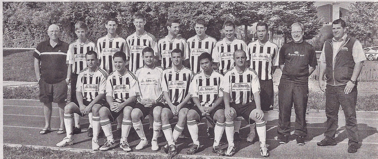
Der FC Elgg ist für die neue Saison bestens gerüstet.

FUSSBALL - Nach dem dritten Platz in der vergangenen Meisterschaft sowie einem neuen Torrekord will der FC Elgg auch diese Saison wieder vorne mitspielen. Das erste Spiel findet am kommenden Samstag in Weisslingen statt. Am