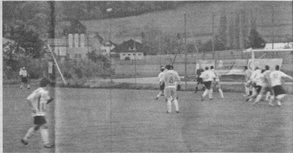
Der FC Elgg setzte das Gästeteam immer wieder gehörig unter Druck.